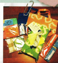
Towel, Coaster, Bag!!!